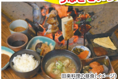
田楽料理の昼食(イブニング)