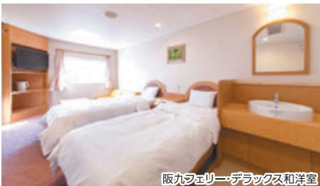
阪九フェリー・デラックス和洋室